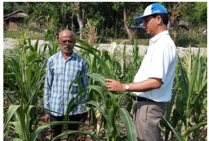
सिंचाईको अभावमा ओइलाएको मकै खेती