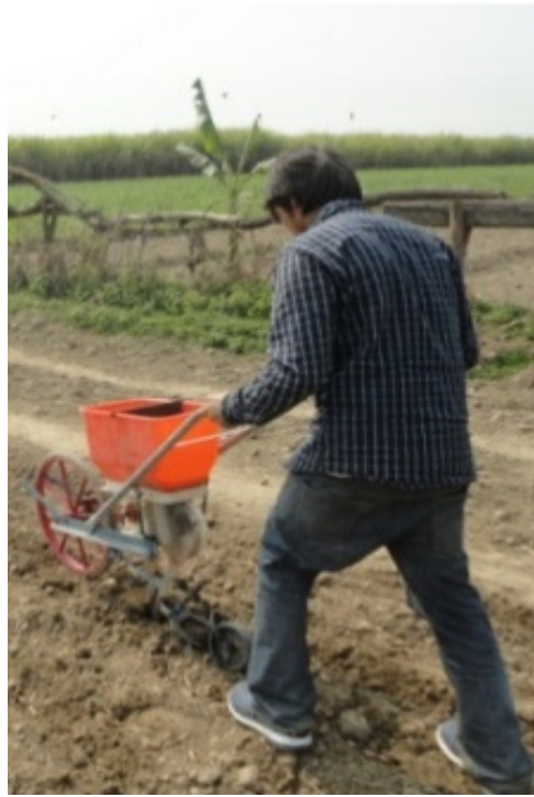
पुस रो सिडर