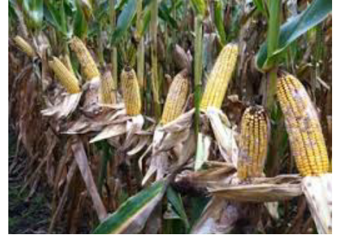
घोगा कुहिने रोग

उक्त रोग नियन्त्रणको लागि मकै धेरै बाक्लो गरी नलगाउने, रोगी बोटलाई नष्ट गर्ने । म्यान्कोजेब नामक विषादि २ ग्राम प्रति लिटर पानीमा मिसाइ ८-१० दिनको फरकमा छर्ने ।