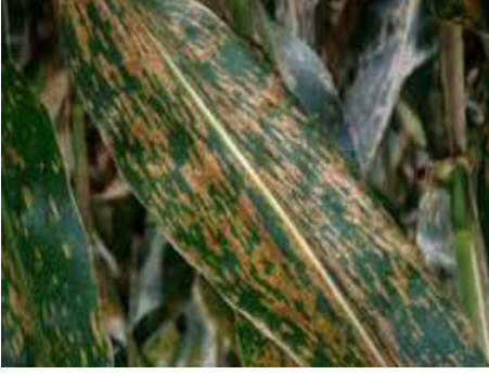
ध्वांसे थेग्ले रोग