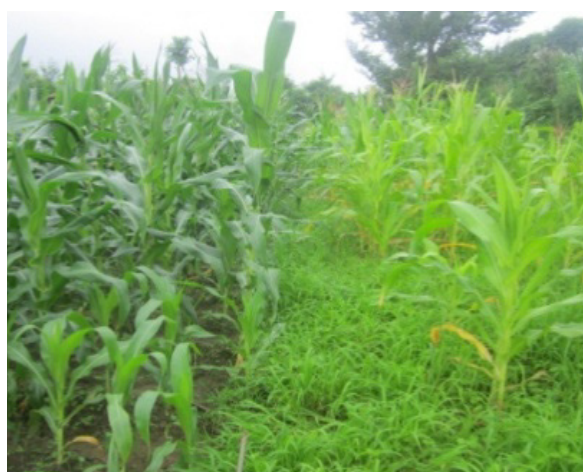
व्यवस्थित मकै खेती (देब्रे) र अव्यवस्थित मकै खेती (दाहिने)

यदि मकै लाईनमा लगाइएको छ भने विभिन्न किसिमको भार गोड्ने मेसिनको प्रयोग गरेर पनि भारपात हटाउन सकिन्छ ।