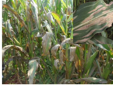
उत्तरी पात डढुवा रोग