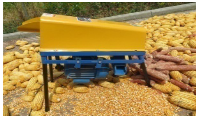
मकै छोडाउने मेसिन