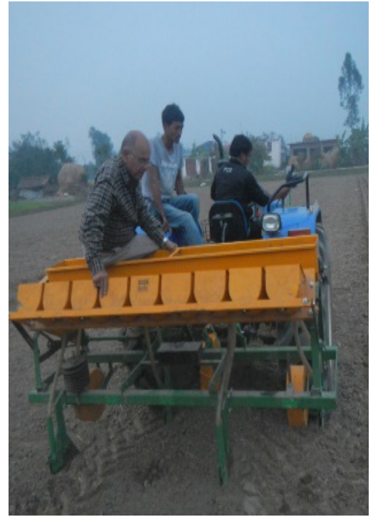
मकै छर्ने मल्टि क्रप सिडड्रिल

चित्र : मकै लगाउन प्रयोग गर्न सकिने मेसिनहरू