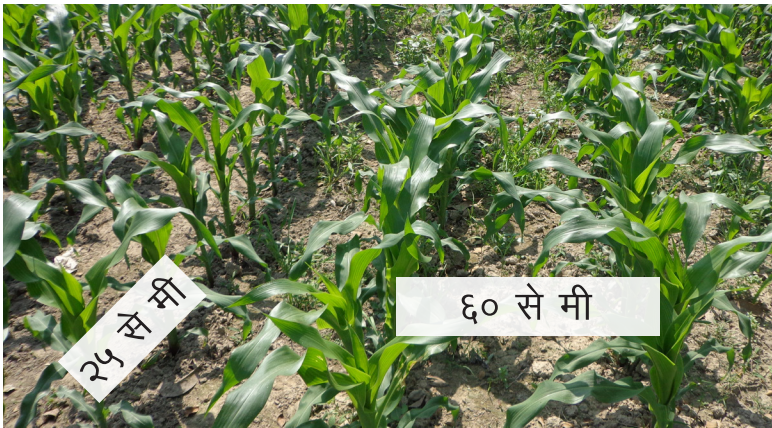
लाईन देखि लाईन (६० से.मी) र बोट देखि बोट (२५ से.मी) मा मिलाएर लगाइएको मकै

नोट : नेपाल सरकारले सुचीकृत गरेको हाइब्रिड जातहरू मात्र लगाउनु पर्दछ र हाइब्रिड जातको बीउ प्रत्येक पटक नयाँ किनेर लगाउनु पर्दछ भने उन्नत जातहरूको बीउ २-३ वर्षमा फेर्दा हुन्छ।