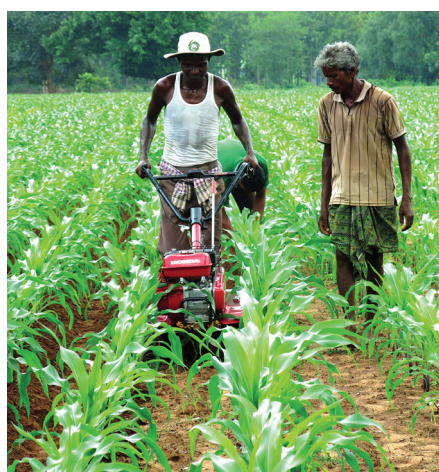
मेसिन प्रयोग गरेर मकै गोड्दै गरेको