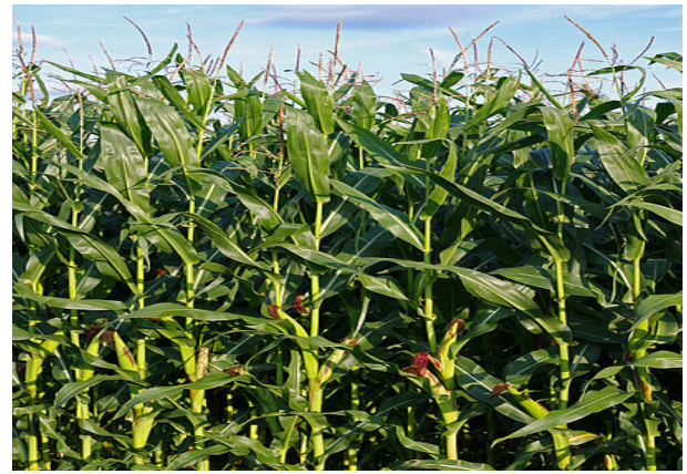
व्यवस्थित तरिकाले लगाइएको मकै खेती